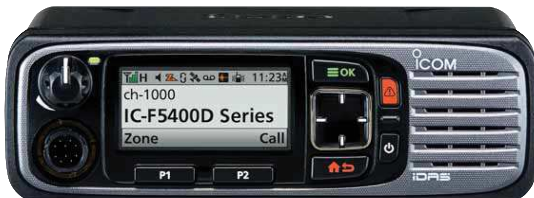
IC-F5400D (VHF) IC-F6400D (UHF)