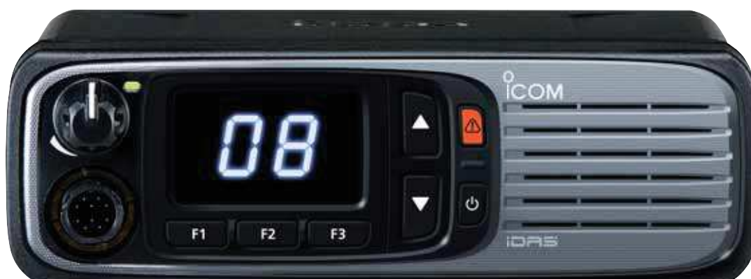
IC-F5400DS (VHF) IC-F6400DS (UHF)