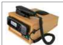
Station d'accueil avec microphone et haut-parleur