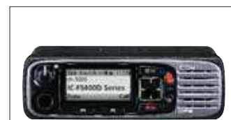
Kit double tête