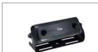
Kit de séparation