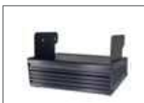
Alimentation de table 13,8 VDC 9A